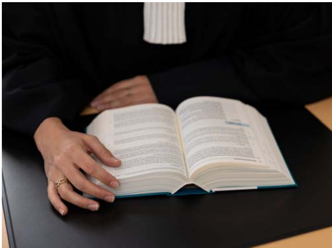
Selon son avocat, l'accusé aurait été «harcelé et menacé» par l'Etat (image prétexte). MURIEL ANTILLE

Ainsi, trois des employés étaient sous-payés avec des salaires sous-enchéris entre 2% et