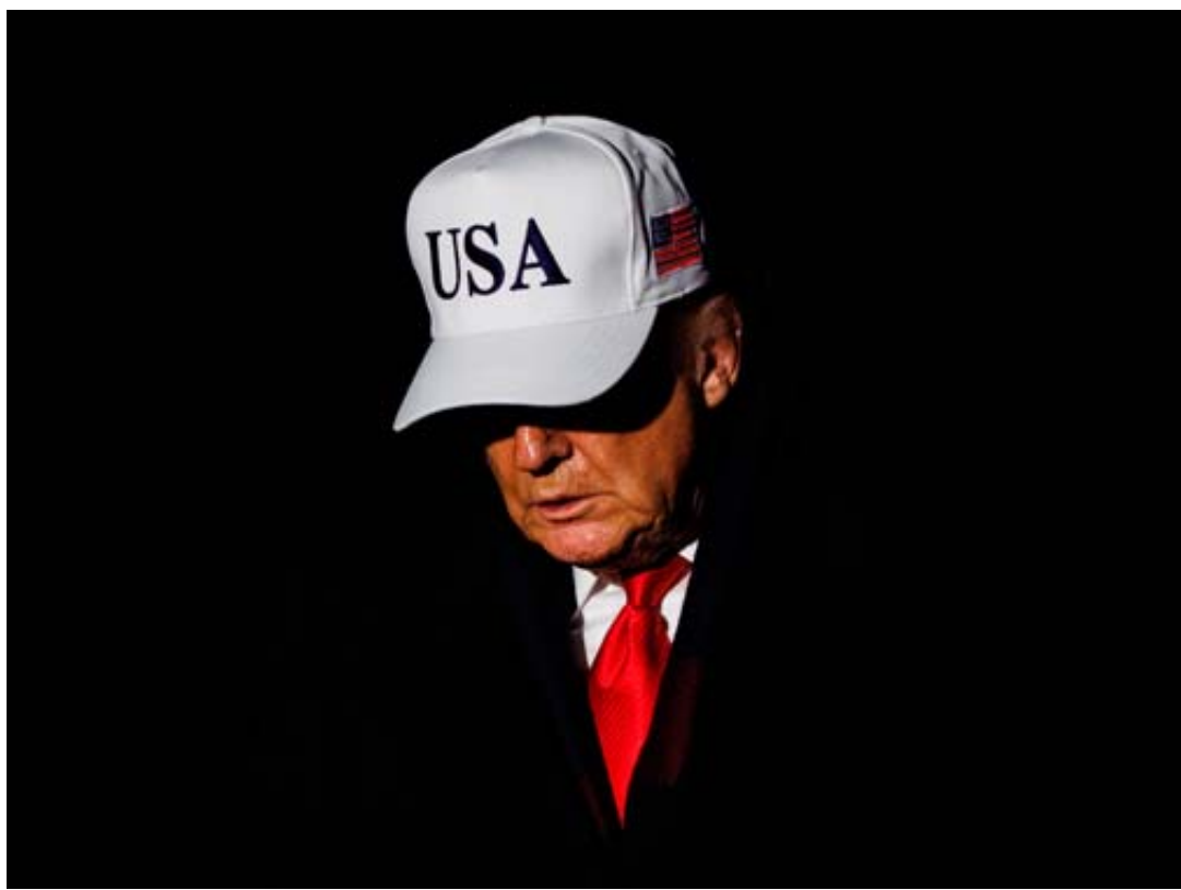
Le bilan géopolitique de Donald Trump n'est pas aussi reluisant que ce qu'il prétend.

Le président américain s'est présenté en grand artisan de l'accord historique signé le 26 octobre entre le Cambodge et la Thaïlande, deux pays d'Asie du Sud-Est, qui s'opposent de longue date sur le tracé de certaines parties de leur frontière, longue de 800 kilomètres et datant de la