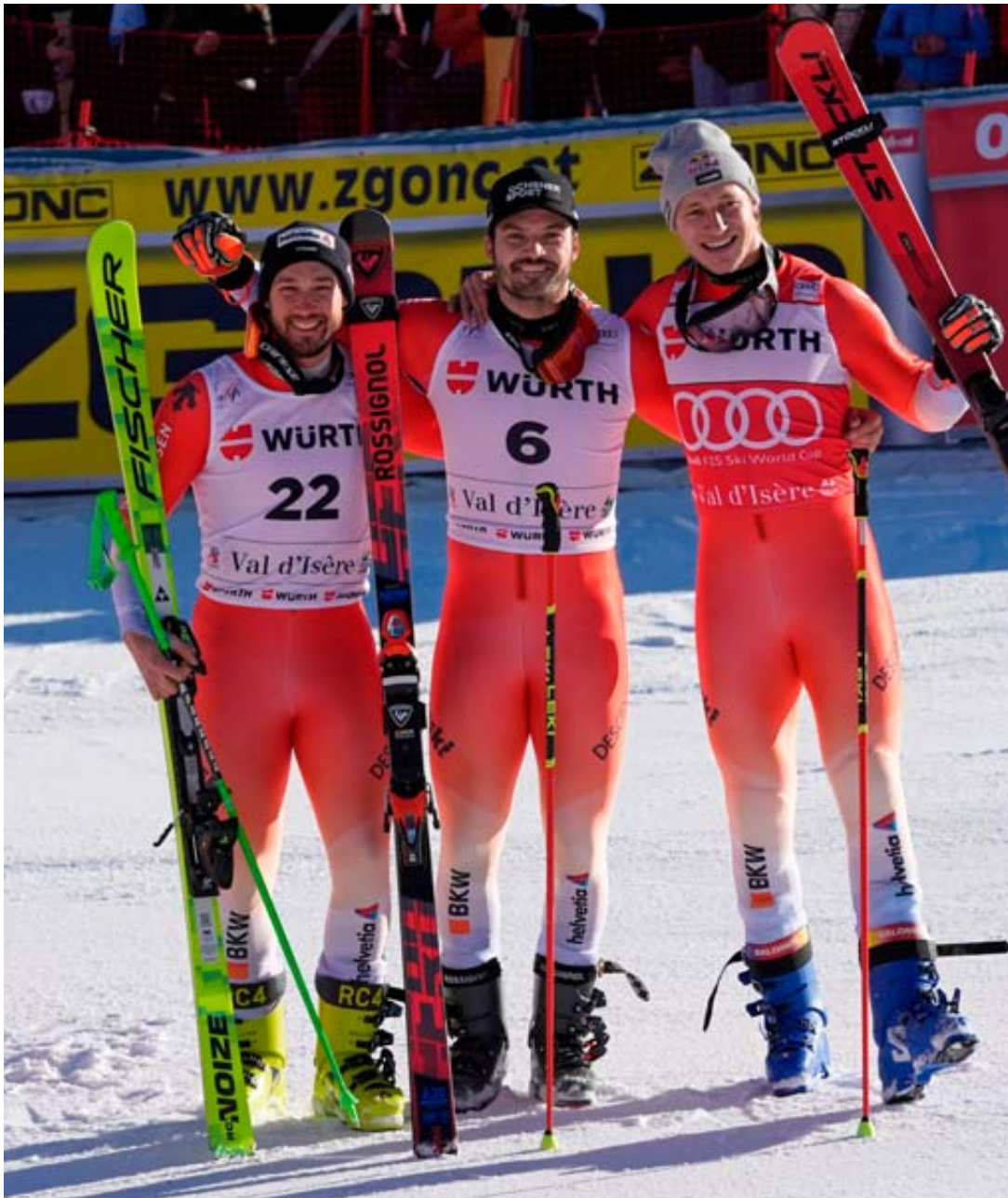
Luca Aerni, Loïc Meillard et Marco Odermatt (de gauche à droite) ont apporté un triplé à la Suisse.

Le retour au premier plan A la veille de cette journée à marquer d'une pierre blanche, le Neuchâtelois Loïc Meillard confiait déjà ressentir de bonnes sensations à l'entraînement, après un début de saison qui n'avait pas répondu à ses attentes. Ce samedi à Val d'Isère, il a retrouvé la lumière, décrochant surtout la huitième victoire de sa carrière. «Avant le départ, j'aurais signé pour un top 5», a avoué Loïc Meillard. C'est que depuis le début de la saison, il cherchait des solutions. «On a passé des