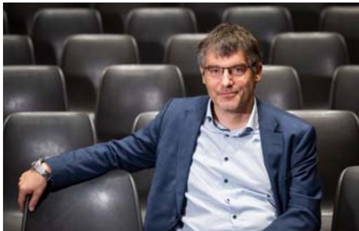
Roger Nordmann lors du congrès de samedi.

Très connu et médiatisé pour son inlassable engagement sur le plan climatique et énergétique, Roger Nordmann avait annoncé en février dernier qu'il