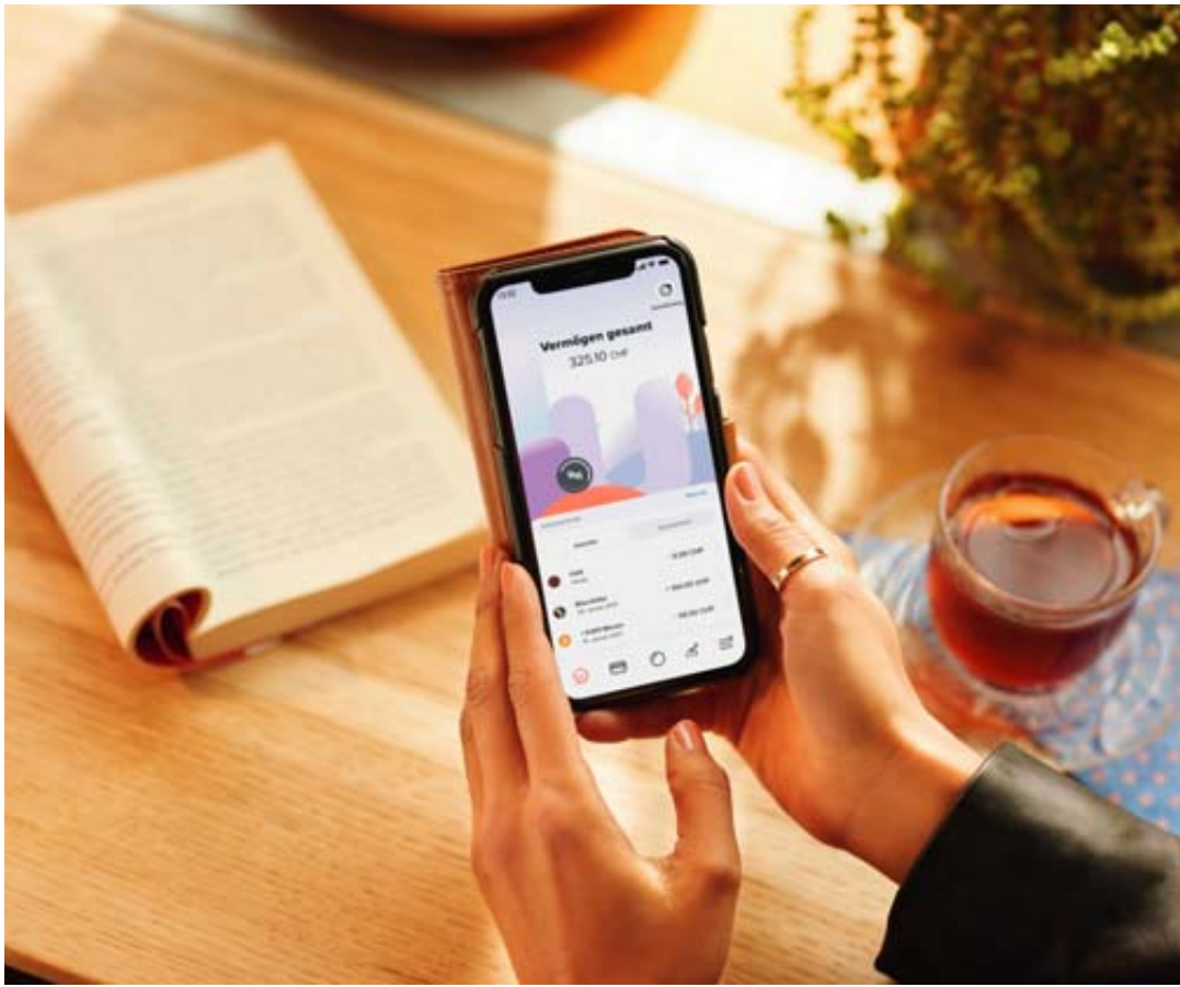
Yuh, néobanque suisse numéro 1, compte actuellement plus de 350 000 utilisateurs.

«Radicañt était un boulet pour le secteur des fintechs (réd: entreprises qui utilisent les nouvelles technologies pour proposer des services bancaires et financiers), pas une figure de proue. Au lieu d'innovation, il