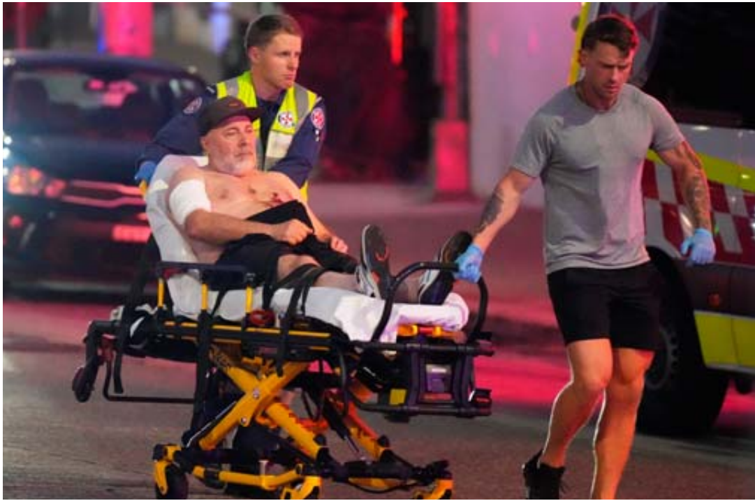
Un blessé transporté d'urgence, hier à Sydney.

«Le mal s'est déchaîné sur la plage de Bondi au-delà de tout