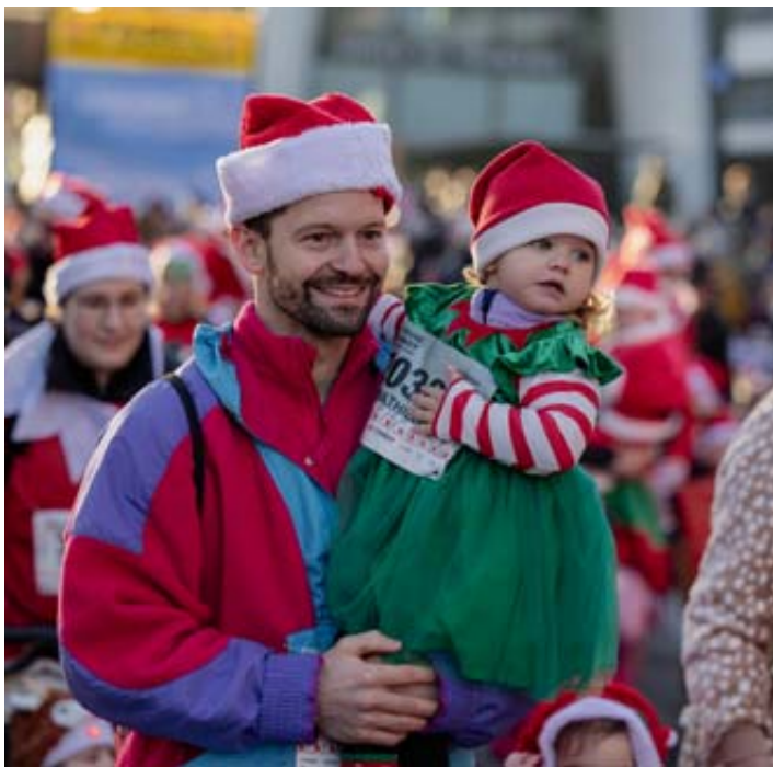
La «Course des Pères Noël et inclusives» a réuni petits et grands.