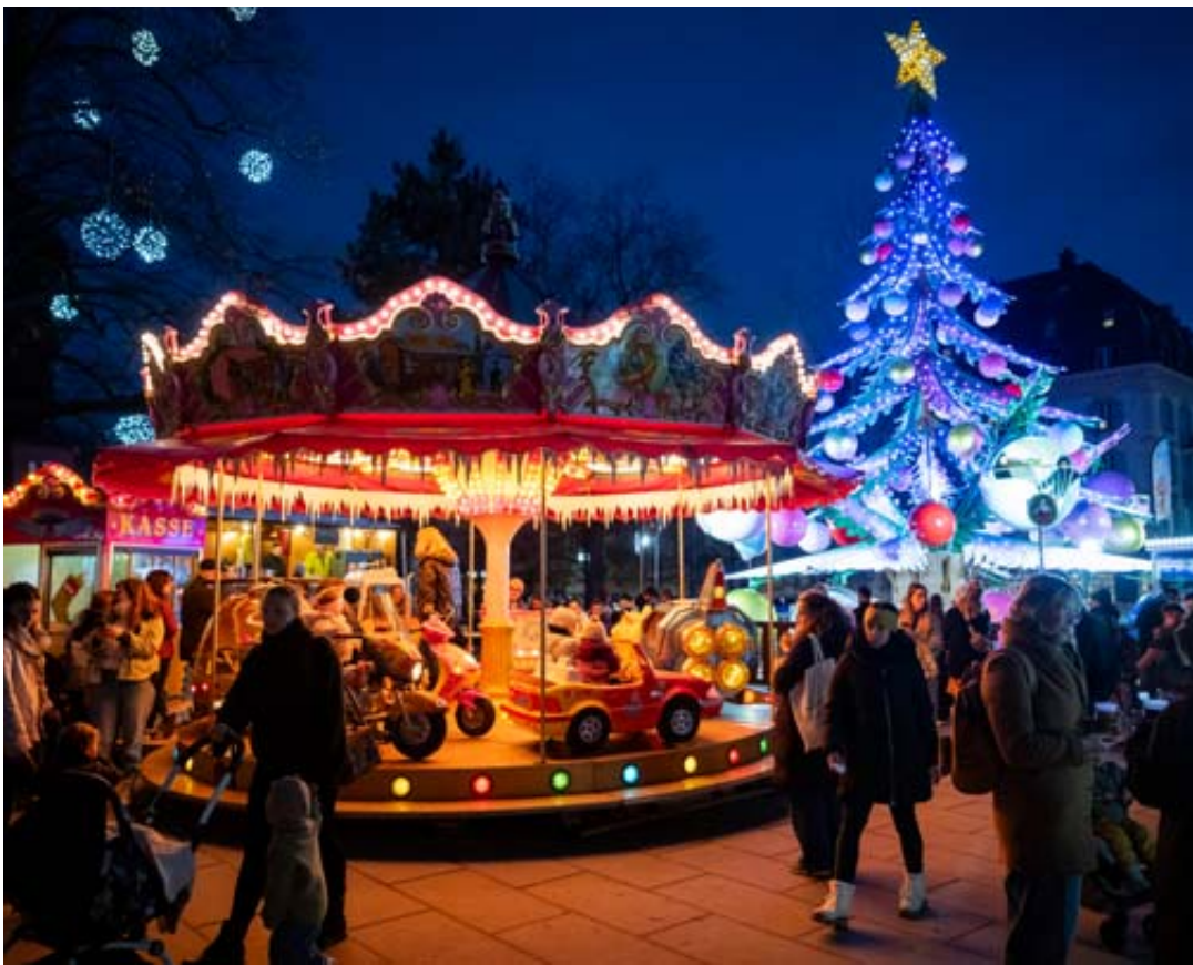
Au marché de Noël du Jardin anglais, le carrousel sapin, avec ses boules qui montent et descendent, attire un nombreux public.

Ouvert jusqu'au 23 décembre. Du mardi au vendredi de 16h à 21h, puis samedi et dimanche de 12h à 21h et le lundi 22 décembre de 16h à 21h. Contes et concerts dans la yourte de 16h30 à 20h environ. Infos: facebook.com/marche.noel.neuchatel