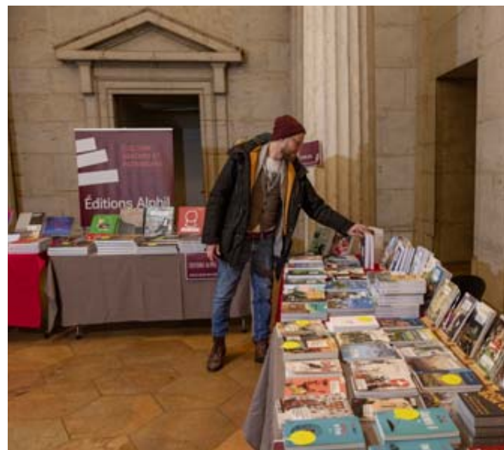
Un visiteur du Salon des éditrices et éditeurs neuchâtelois sur le stand des éditions Alphil.