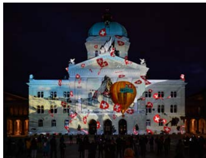
Aujourd'hui et demain, les Chambres fédérales vont aborder des moyens de soutenir l'industrie suisse lors d'une session spéciale.

Beaucoup de ces textes n'ont pas trouvé grâce aux yeux du Conseil fédéral, qui recom-