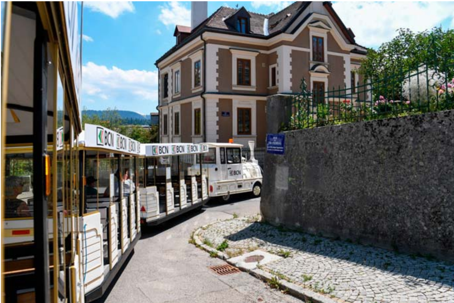
Le petit train touristique circule dans les deux villes du Haut depuis 2009.