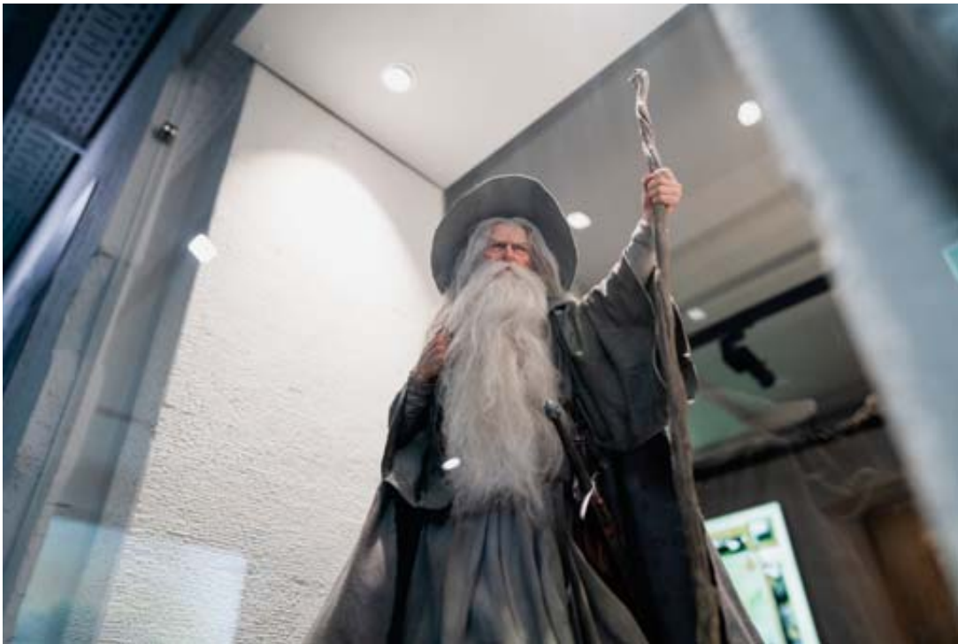
Le personnage de Gandalf est présent en trois dimensions.