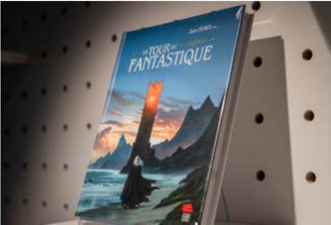
John Howe a publié ce livre, tout juste sorti de presse, chez Alphil.

La «Tour» devra s'autofinancer La fondation Neuchâtel Fantastique, qui a été créée pour lancer, puis exploiter la Tour du fantastique, se trouve devant un défi de taille: elle devra équilibrer son budget, année après année, sans être soutenue financièrement par une ou plusieurs collectivités publiques. Elle devra s'autofinancer. L'institution aura en revanche bénéficié d'un appui conséquent avant son ouverture: propriétaire des bâtiments, le Canton a investi 5,4 millions de francs dans les travaux d'assainissement et de transformation. La Ville de Neuchâtel, elle, a engagé 1,5 million pour soutenir le lancement de la «Tour», non comprises les ressources humaines mises à disposition.