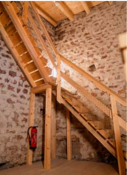
Les escaliers intérieurs refaits de la tour des Prisons.