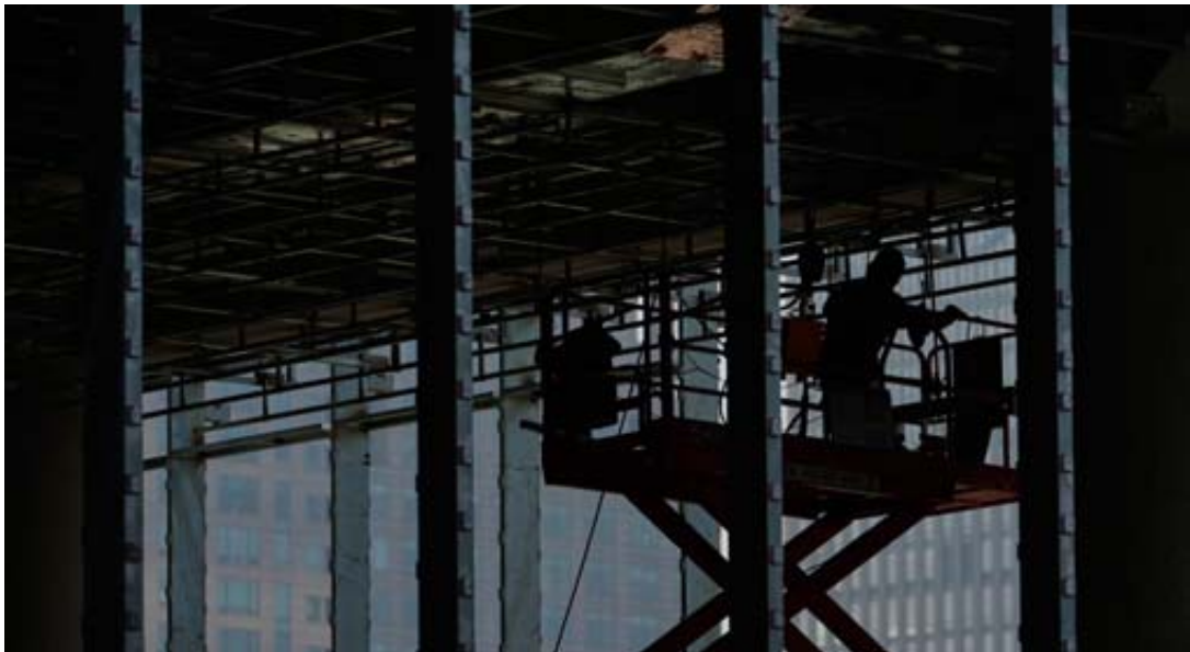
La nouvelle convention collective de travail pour le secteur du bâtiment obtient de meilleurs résultats que dans d'autres secteurs, où les gains sont timorés (image d'illustration).

Avec ses associations membres Syna et Transfair, Travail.Suisse avait réclamé cet été une augmentation des salaires nominaux de 2%. Avec un taux d'inflation prévu de 0,5%, cela aurait représenté une croissance réelle des salaires de 1,5%. Compte tenu également de la hausse des primes d'assurance maladie, les salaires seraient revenus à leur niveau d'avant la pandémie. Travail.Suisse en conclut que ses revendications «modérées» sont «loin» d'avoir été acceptées par les employeurs. Selon ses calculs, le syndicat n'a obtenu