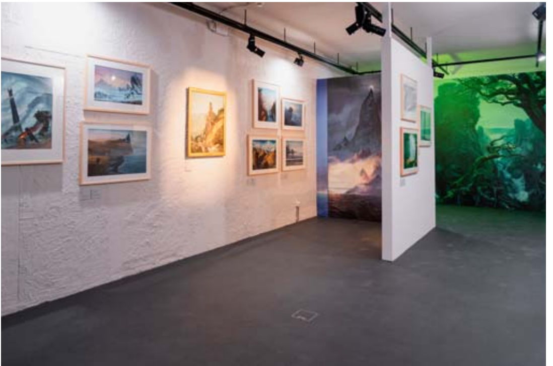
L'exposition propose 270 œuvres de John Howe, dont 150 originaux.