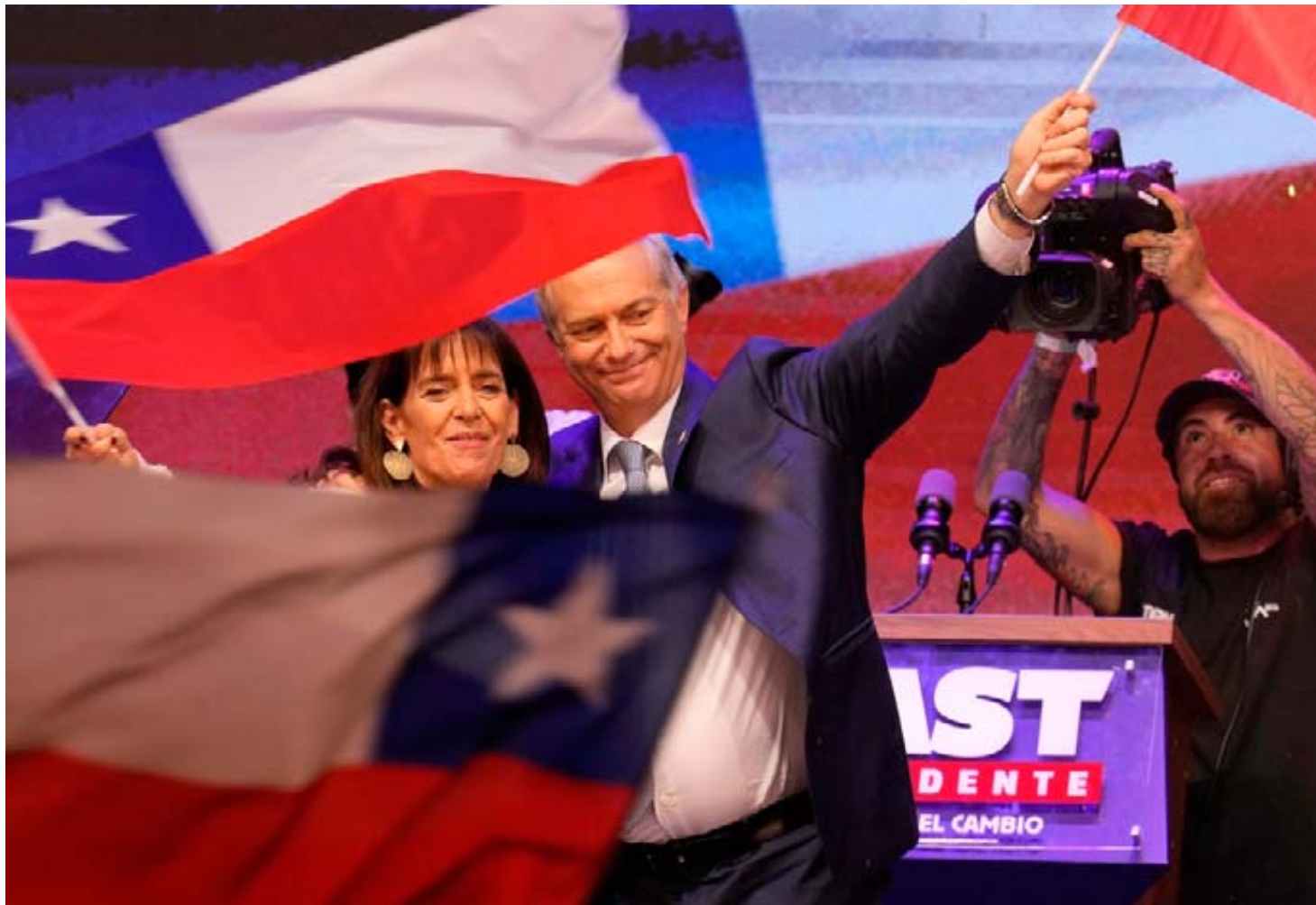
Pour sa troisième course à la présidence, José Antonio Kast a relégué au second plan un agenda conservateur qui lui avait coûté des voix lors de sa précédente candidature face à Gabriel Boric en 2021.

Moins exubérant que d'autres dirigeants d'extrême droite, son idéologie n'est pas moins radicale: José Antonio Kast, élu dimanche président du Chili, est un ultraconservateur et admirateur assumé du dictateur chilien Augusto Pinochet.