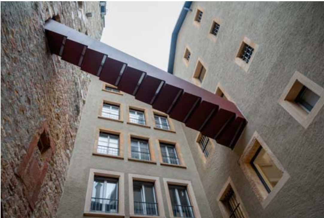
Une passerelle relie la tour des Prisons (à gauche) et l'ancienne prison.