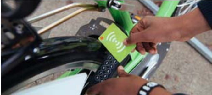
La mise en place d'une troisième station de vélos en libre-service a été saluée par le Conseil général.