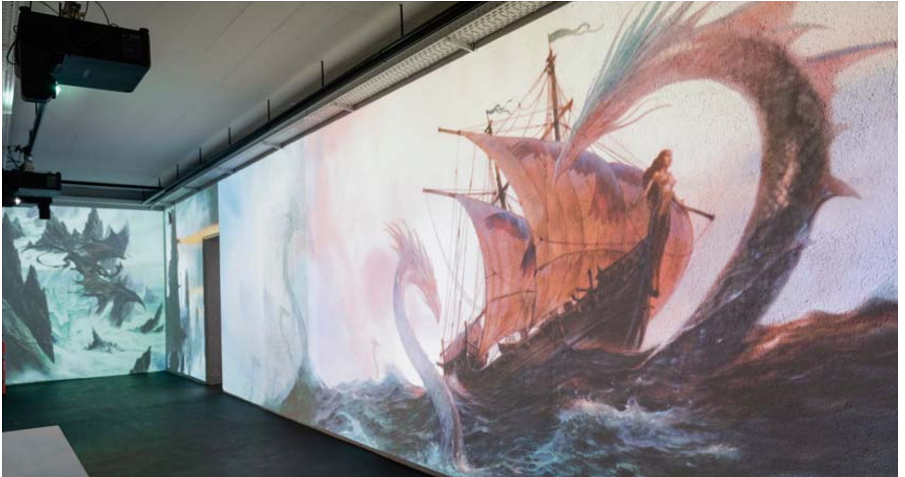
Le dragon, un thème cher à John Howe.