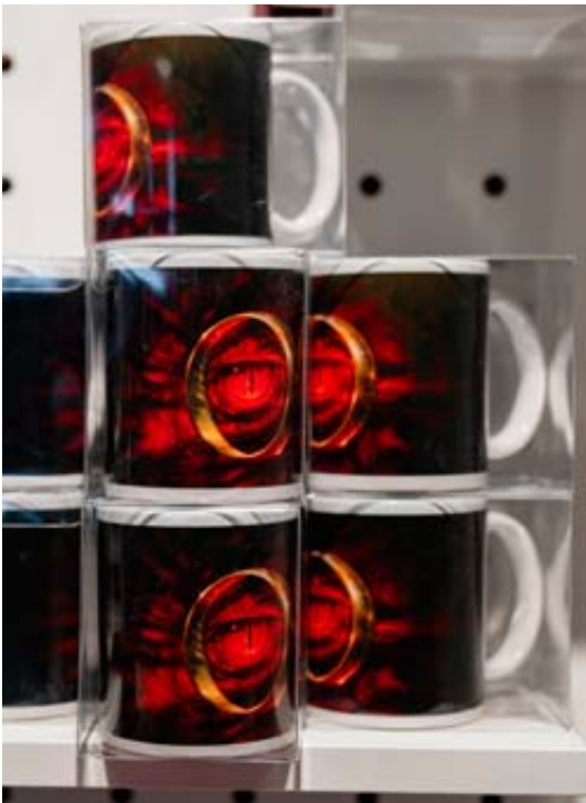
Ces mugs sont vendus à la boutique.