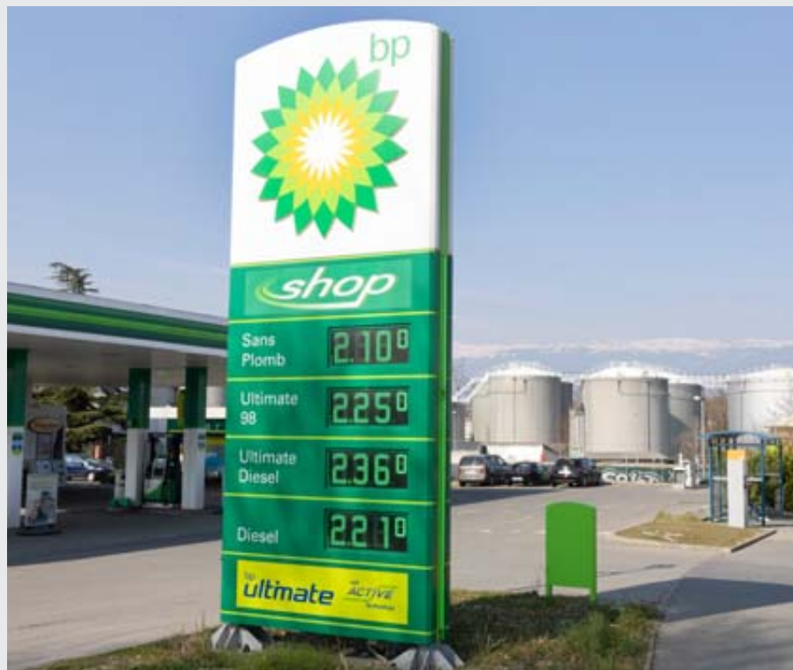
Depuis le début du mois de mars, le prix de l'essence a fortement grimpé comme ici dans une station-service genevoise, le 7 mars.

On ne fait jamais autant attention à l'environnement que lorsque c'est le porte-monnaie qui parle. Est-ce pour rire ou pour pleurer? Evidemment, on se fiche complètement de l'environnement quand on achète de l'essence, puisqu'on achète de l'essence. Et, comme le suggère «ArcInfo», «et prendre les transports publics? Oui. Mais ce n'est pas toujours possible.» Ce n'est surtout pas possible tant que les autorités, les lobbies et les rentiers (n'entendez pas les retraités) persisteront à vouloir maintenir, à coup de subventions, le mode de mobilité le plus destructeur de l'environnement qu'est l'automobile. Certes, ses subventions sont bien cachées puisqu'elles se trouvent dans les coûts cachés. L'administration fédérale les connaît assez bien. Ces coûts sont estimés à plus de 20 milliards de francs par année. Et même le Conseil fédéral n'en tient aucun compte tant il est contrôlé par les lobbies. Quant à investir dans une bagnole électrique, c'est équivalent au geste de l'autruche qui se met la tête dans le sable. Essentiellement, une voiture électrique est une voiture qui émet son CO2 à distance, c'est-à-dire là où l'on produit son électricité.