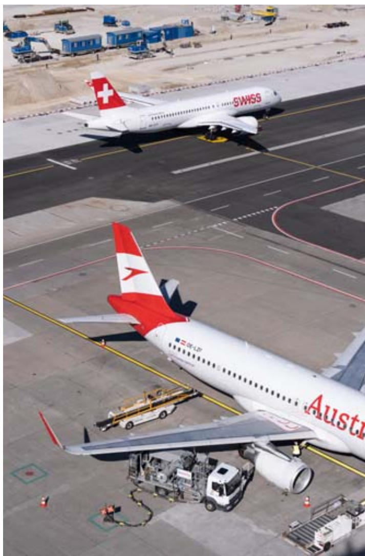
Le carburant représente entre 20% et 35% des coûts d'exploitation des compagnies aériennes.

La semaine dernière, la tonne de kérosène se négociait en moyenne à 1562 dollars, selon les données de la faïtière du transport aérien Iata. Cela représente un bond d'environ 120% sur un an. Les perturbations sur le marché risquent