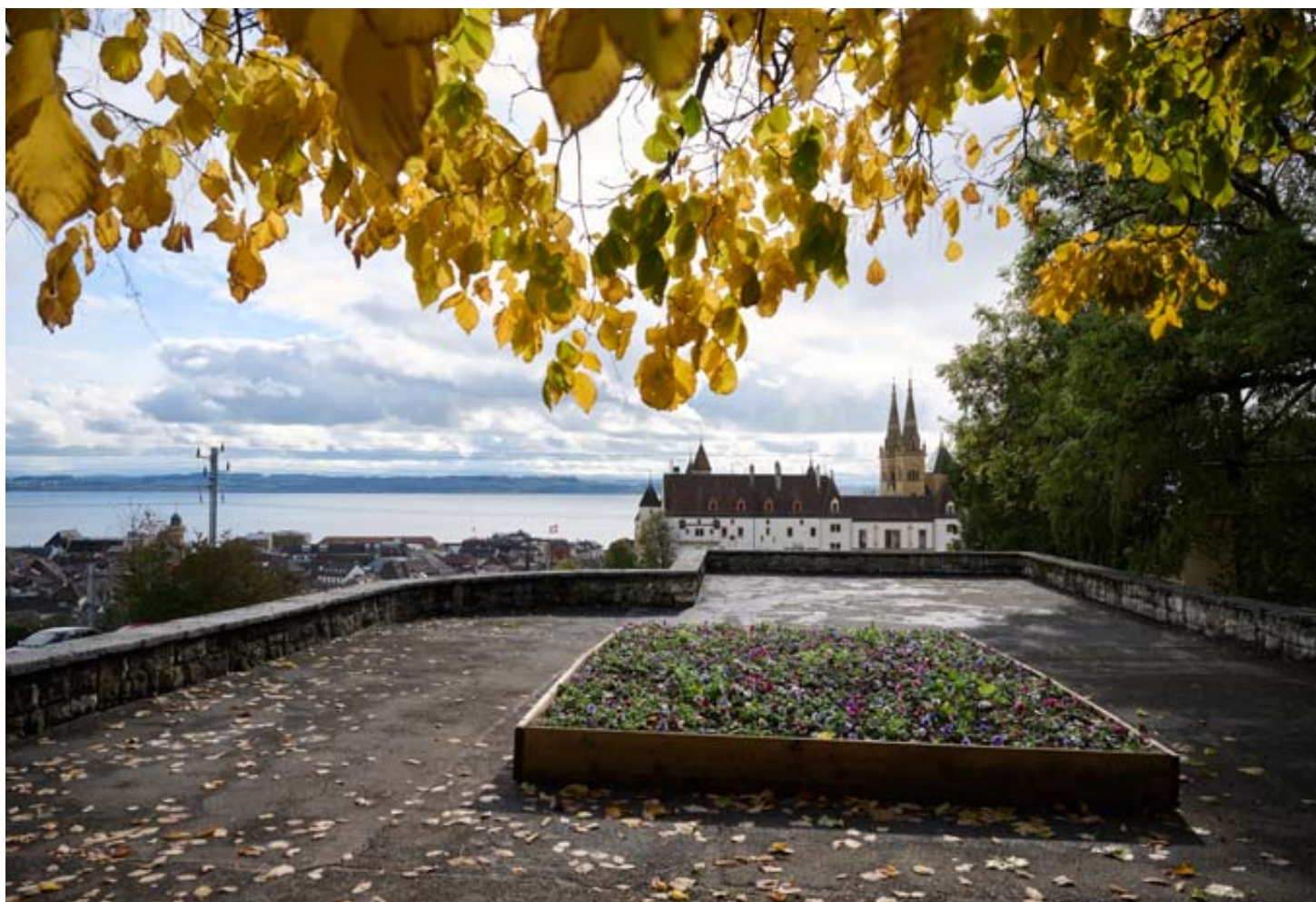
La vue exceptionnelle sur la colline du château dont l'on jouit depuis le parking de la Chaumière bénéficie d'une protection spéciale.

Ce projet avait été présenté au Conseil général en mars 2019. Après un long débat et plusieurs amendements, cette modification du plan d'aménagement