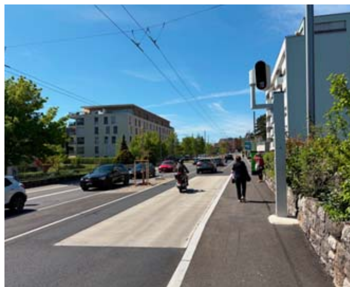
Le radar se trouve dans le quartier de Monruz, à l'entrée de la ville en venant d'Hauterive. PASCAL HOFER

est resté réglé sur une limitation à 30 km/h», indique Elsa Girardin, porte-parole de la police neuchâteloise, confirmant les informations d'ArcInfo». L'appareil a donc continué de flasher les véhicules roulant à une vitesse située entre l'ancienne et la nouvelle limite maximale, soit entre 30 km/h et 50 km/h. Ce qui, à cet endroit de la ville, a vite fait beaucoup de monde... «Le radar a flashé 3468 véhicules