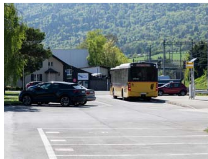
Le Conseil communal de Boudry souhaite qu'un car postal relie sa gare CFF à celle de Chambrélien. LUCAS VUITEL

CarPostal est prêt à fournir cette prestation, que l'entreprise facturerait 750 000 francs pour trois ans. «Il faudra