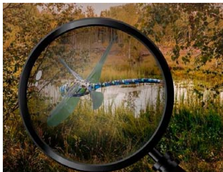
Découvrir le sentier de la tourbière accompagné d'un guide transforme une simple promenade en une expérience immersive et éducative. SP

organisées un jour par mois, à compter de ce dimanche, sans inscription préalable, avec le soutien de Pro Natura. «Ces visites permettent de découvrir l'espace muséal puis le sentier de la tourbière en compagnie d'un ou d'une guide expérimentée au prix de 10 francs par adulte et 7 francs pour les enfants», indique Yvan Matthey, spécialiste des marais et collaborateur scientifique chez Pro Natura.