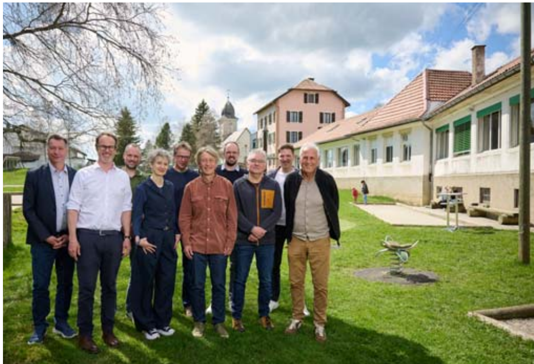
La Commune de La Chaux-du-Milieu souhaite vendre le bâtiment à l'association Avenir Chante-Joux, afin que perdure le centre d'hébergement collectif. DAVID MARCHON

Passer d'un hébergement collectif à un épicerie touristique... C'est la volonté de l'association à but non lucratif Avenir Chante-Joux, qui a présenté le 21 avril à la presse, ainsi qu'à la population, le projet d'achat et de rénovation de la Maison de Chante-Joux.