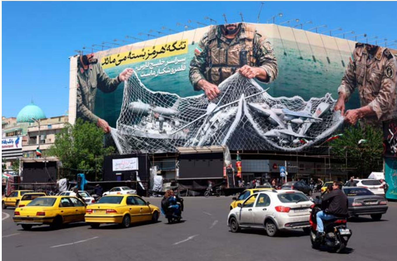
Une affiche de propagande au centre de Téhéran montre des avions et des navires étasuniens pris dans les mailles du détroit d'Ormuz représenté ici sous la forme d'un filet de pêche tenu par des militaires iraniens.

Sur le plan diplomatique, la situation reste confuse, en l'absence à ce stade de reprise des discussions entre les deux belligérants pour tenter de trouver une fin durable à une guerre qui a fait des milliers de morts – essentiellement en Iran et au Liban – et ébranlé l'économie mondiale. Donald Trump a prolongé sine die le cessez-le-feu avec l'Iran mardi soir, à quelques heures de l'expiration annoncée, afin de laisser davantage de temps aux Iraniens pour joindre les négociations de paix sous l'égide des médiateurs pakistanais. Il a parlé d'une extension jusqu'à ce que «l'Iran présente une proposition et