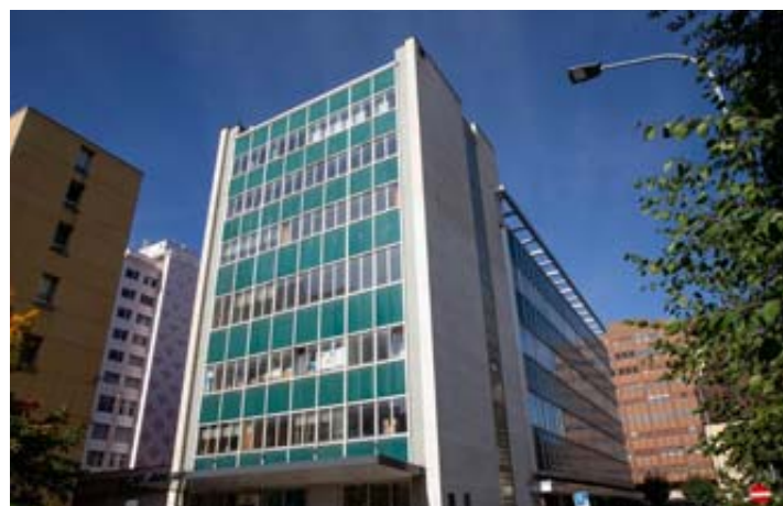
Bâti en 1956, le bâtiment qui abritait l'Unip est emblématique de la période des Trente Glorieuses. MURIEL ANTILLE

«Les bâtiments sont passés dans différentes mains. Il y a maintenant une volonté d'assainir», dit Boris Evard à propos du premier ensemble. «Il y a un gros problème d'enveloppe thermique.