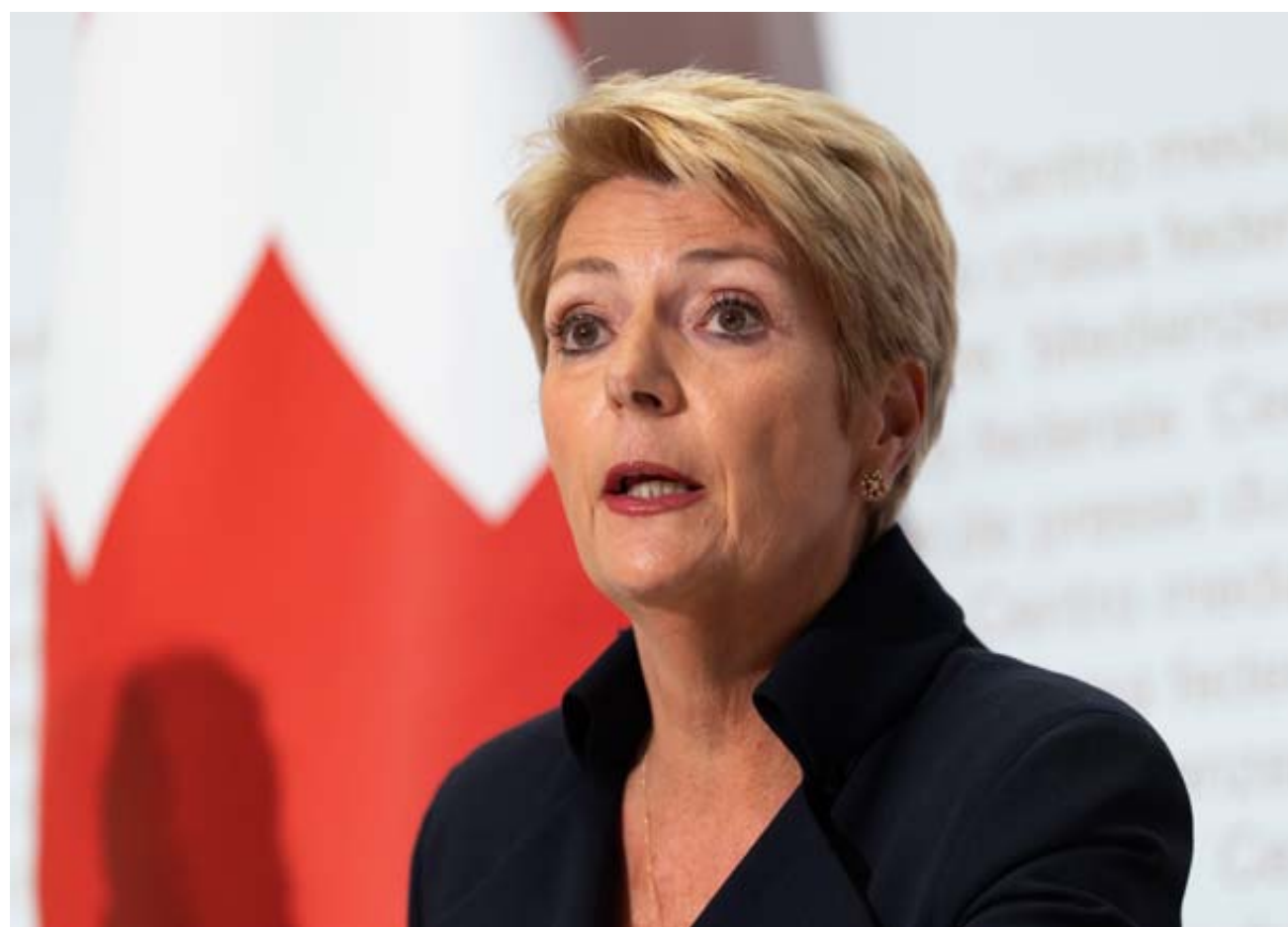
La grande argentière de la Confédération, Karin Keller-Sutter, hier à Berne.

Après la phase de consultation, le Conseil fédéral a mis un peu d'eau dans son vin. Mais il reste ferme sur le cœur du projet. Celui-ci prévoit que les banques d'importance systémique doivent entièrement (100% contre 45% aujourd'hui) couvrir au moyen de fonds propres la valeur comptable des participations qu'elles détiennent dans des filiales étrangères. Dans les faits, on peut parler de «Lex UBS» car elle est aujourd'hui la seule banque suisse d'importance systémique à détenir de telles participations à l'étranger. Pour le reste, le gouvernement a assoupli les règles en matière de logiciels notamment. Au lieu d'être entièrement couverts par des fonds propres, les logiciels devront être amortis dans les trois ans au maximum, par analogie avec la réglementation européenne.