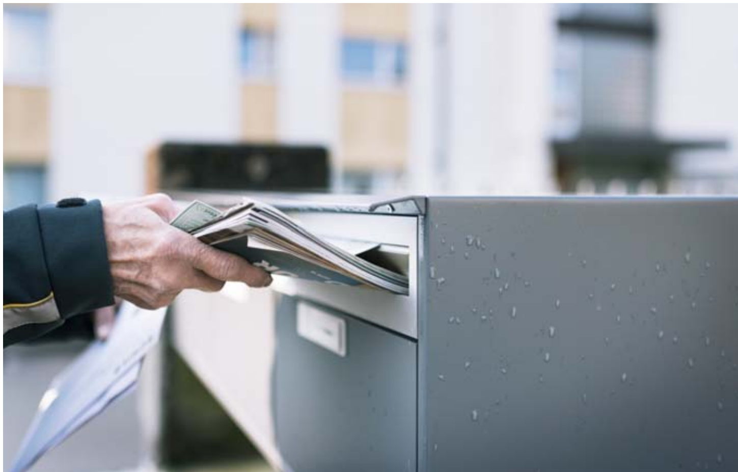
Outre la distribution du courrier adressé, La Poste assure de plus en plus celle de la publicité et des journaux imprimés.

La société avait repris le mandat de distribution de notre quotidien en août 2025. C'est dans ce contexte qu'elle avait conservé une partie de